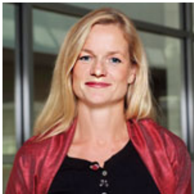
Viola von Cramon-Taubadel